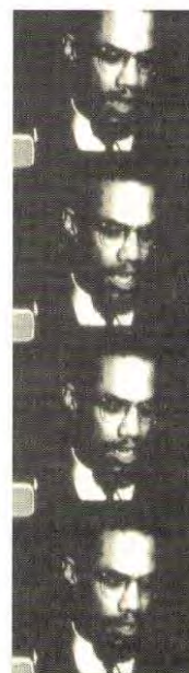
A presenza de Malcolm X nun flash-back imposible, en Perfect Film.

Se Tom, Tom... era unha película introspectiva, unha glosa, que mantiña o título orixinal como sinal de identidade (a nova obra como estudo da orixinal), The Doctor's Dream, aparentemente máis sinxela, subverte quizá aínda máis o modelo narrativo convencional. Tom, Tom... nacia do amor e respecto polo cinema; The Doctor's Dream desvirtúa o orixinal: de aí a modificación do título. A abstracción da imaxe en Tom, Tom... é agora a abstracción da estrutura; se naquel caso custaba aceptar o grao da imaxe non-referencial como obxecto de placer visual, ago-