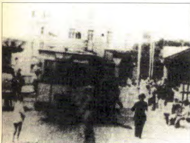
O tranvía de Opening the 19th Century: 1896 a cámara dos Lumière irá montada noutro tranvía que o precede.

Volvemos co segundo entrevistado na seguinte secuencia, que emerge tras destellos de luz que cegan a pantalla, para desaparecer de novo. Logo, repetición de planos: entrada do teatro; xente esperando, con destellos; volve Jim, repetindo o mesmo desde un novo punto de vista: volve-se para a dereita, como a primeira vez, mas esta vez non se corta o plano, e contesta ao segundo repoteiro: Jim tamén é xornalista, mas non estaba