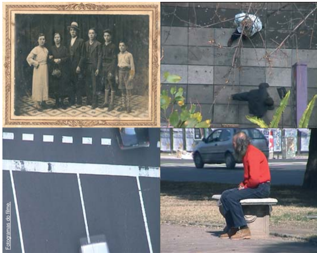
Fotogramas do filme.