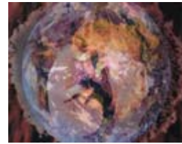
Poussière d'étoile (Programme 1)

Flux Marseille ( Flux Marseille ), de Camille Galle, Emmanuel Bez ( France , 2008, 7 mn 40 s).