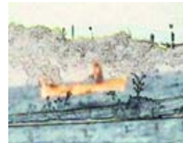
Sous-perposé (Programme 2)

Sous-perposé ( Sous-perposé ), de Jean-Luc Aimé ( France/Grèce , 2008, 17 mn).