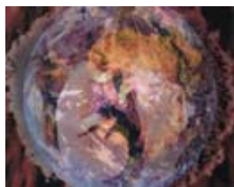
Stardust (Programme 1)