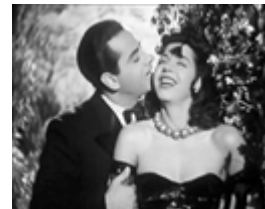
Vidéo-concert (Programme 3)

Coulée douce ( Coulée douce ), de Ismaïl Bahri ( Tunisie/France , 2007, 3 mn 13 s).