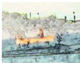
Sous-perposé (Programme 2)