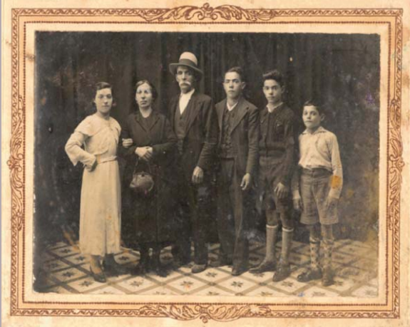
Bs. As. (2006). Mejor ensayo / Best film-essay (Premio Cine-Ensayo Román Gubern). Mejor documental gallego / Best Galizan documentary (Play-Doc)