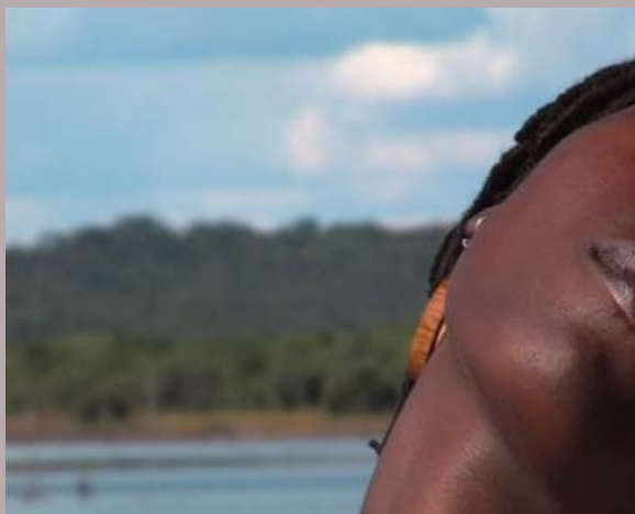
Tanyaradwa (2009). Mejor documental gallego / Best Galizan documentary (Play-Doc)