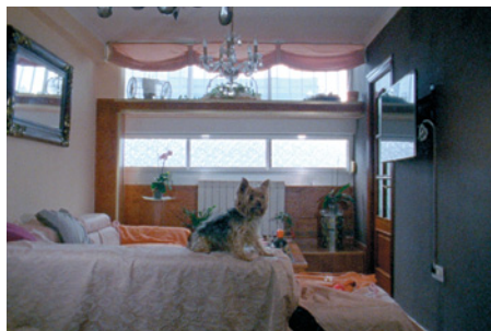
Unidade veciñal , 2020

Domestic images that look as if they had been unearthed from the very soil of memory. A lost childhood. Motherhood. An emotional collage soaked in colors and textures that she made for Cintaadhesiva , a literary and musical project that brings together the music of Jesús Andrés Tejada and Silvia Penas' texts.