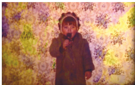
Miña nai , 2016